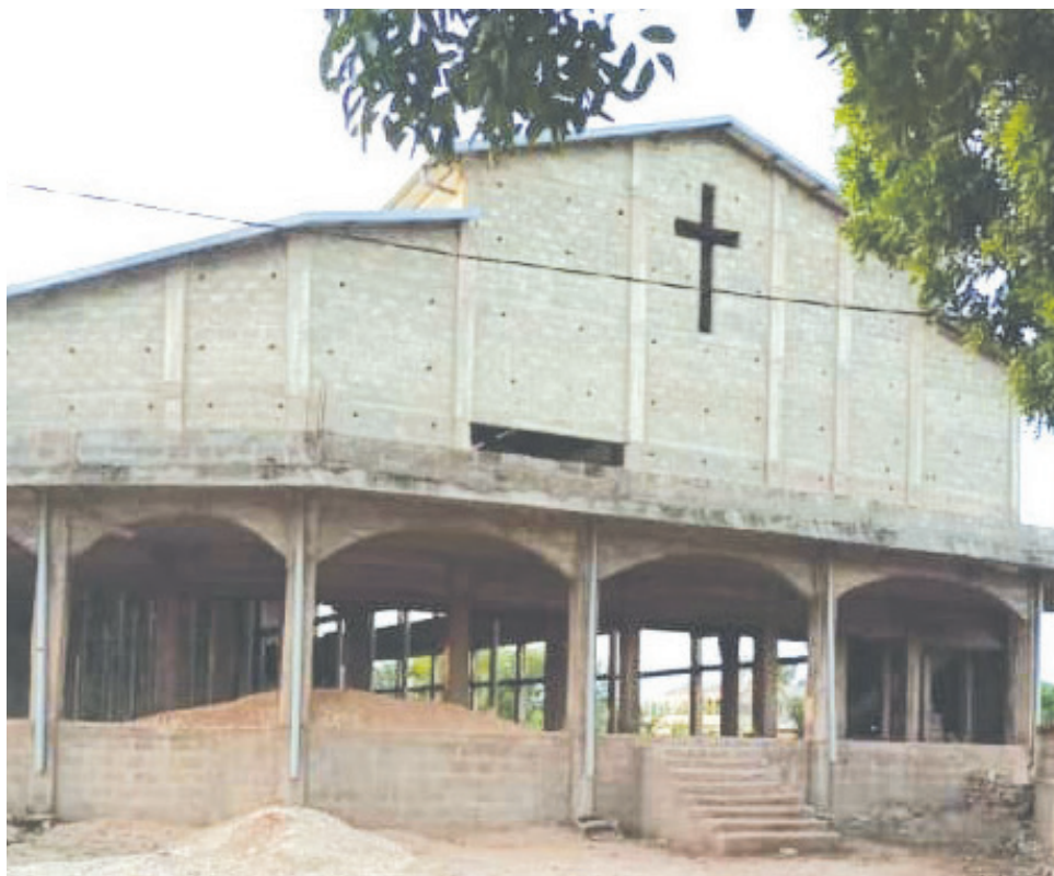
Église Notre-Dame de la Divine Miséricorde de Ségbé-Comé en construction

ISSN 1840-9822 Bulletin bimestriel diocésain N° 003 (1 ère année) Mai - Juin 2020