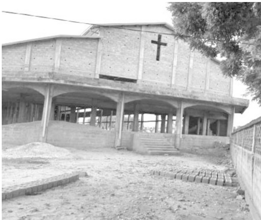
Église Notre-Dame de la Divine Miséricorde de Ségbé-Comè en construction