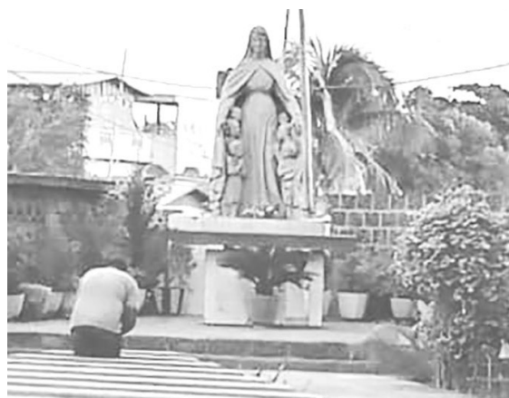
Notre-Dame de la Divine Miséricorde de Ségbé-Comé

La communauté chrétienne de Ségbé est répartie en six communautés ecclésiales de base, préparées et établies depuis 2016, avec à leur tête, des responsables élus. Ce précieux instrument de pastorale de proximité, de charité fraternelle, vivante, responsable et authentique reste à découvrir, et la lettre pastorale de l'évêque pourrait aider à mieux l'accueillir.