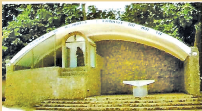
Une Grotte mariale pour vos célébrations