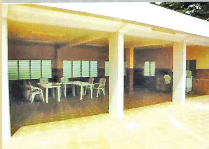
Une plate-forme en plein air pour vos réceptions. Capacité: 250 places